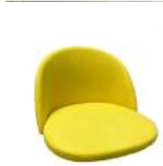
Мягкая часть стула (№5)

ВАЖНО. Предприятие-изготовитель оставляет за собой право без предварительного уведомления Покупателя вносить изменения в конструкцию, комплектацию или технологию изготовления изделия с целью улучшения его свойства.