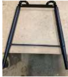
Пара ножек (№2)

Винт М6х20 4 шт. Винт М6х45 4 шт. Шестигранник 1 шт. Саморез 8 шт.