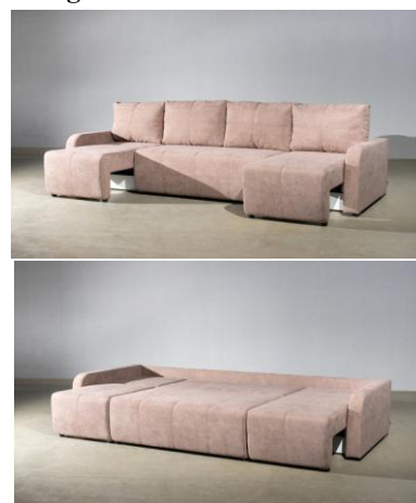
механизм трансформации «Тик-так»